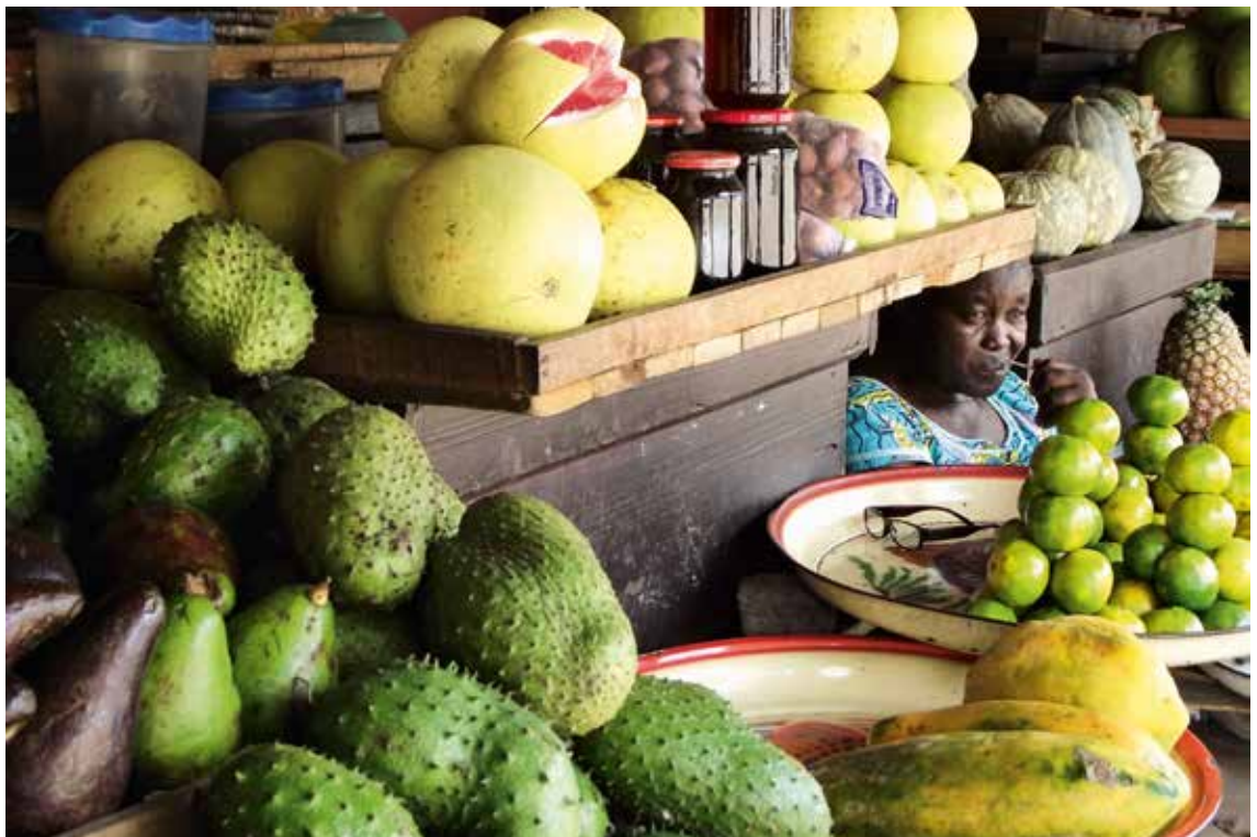
2. Soberanía alimentaria en los proyectos de desarrollo, 2010.