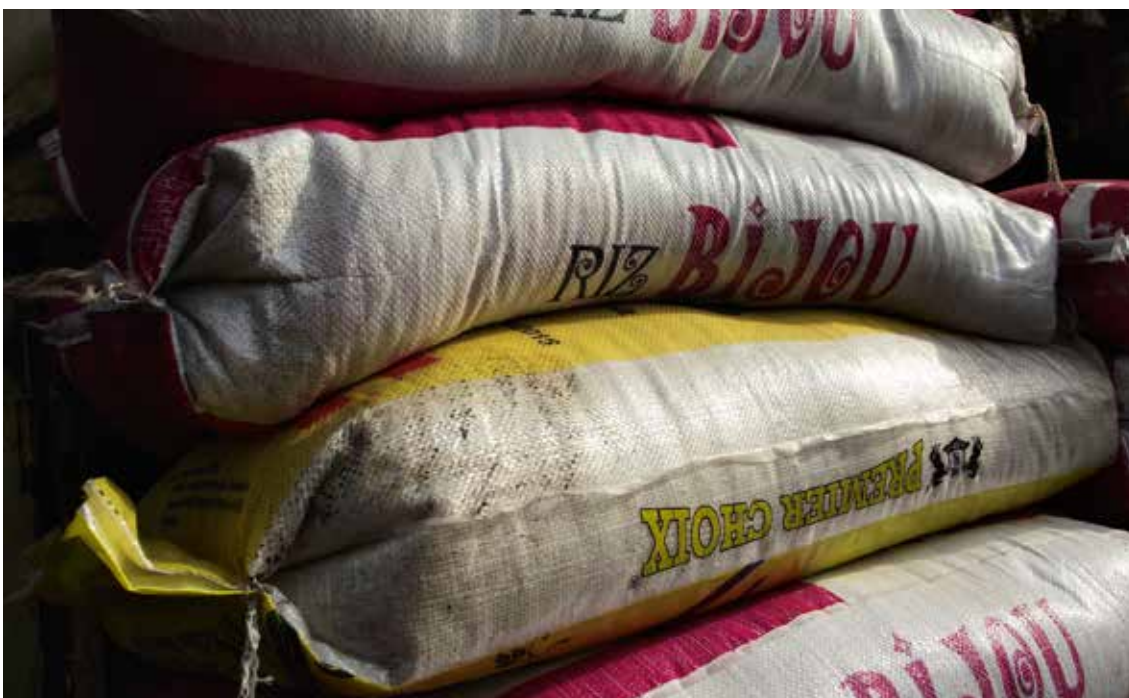
1. ADISCO, Capitalisation des expériences de souveraineté alimentaire au Burundi et dans la région des Grands Lacs, février 2013

En revanche, le GPA a essuyé un revers avec la détaxation, en 2013, des importations de produits de première nécessité (riz, haricot, lait, etc). Cette décision du Gouvernement faisait écho aux revendications d'un Mouvement contre la faim constitué de nombreuses organisations de la société civile et syndicats. Les importations de ces biens ont bénéficié d'une exemption ponctuelle de TVA, puis d'un taux abaissé (12% actuellement contre 18% avant la crise). Ce problème montre la nécessité de sensibiliser les organisations de la société civile aux intérêts des paysan-ne-s et de rechercher des convergences. Le soutien à des circuits courts de transformation et de commercialisation en milieu urbain permettrait aussi de mieux valoriser les produits de l'agriculture familiale.